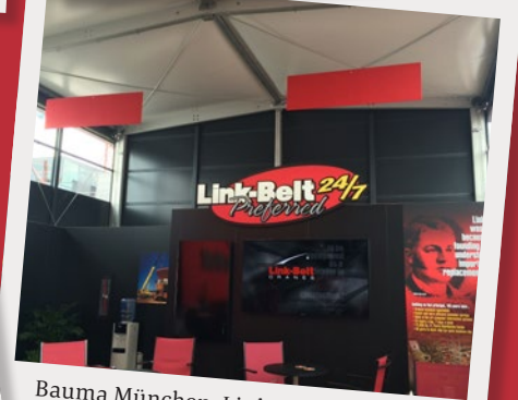
Bauma München, Link Belt, Manhattan Cube Tyrol, April 2016