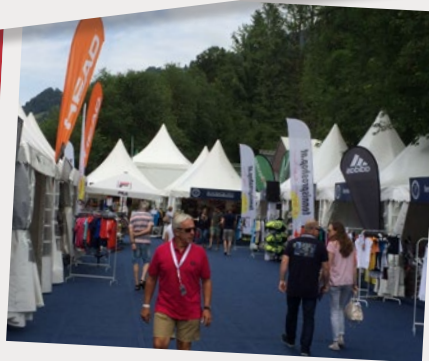
72. Generali Open Kitzbühel, Juli 2016