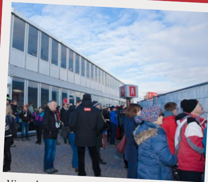
Vierschanzentournee Innsbruck Bergisel, Jänner 2016