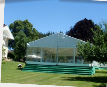
ASI Reisen Natters, Sommerfest im Juni 2016