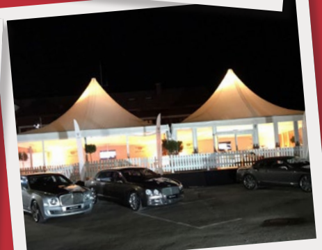
Bentley Jochpass Rallye, Bad Hindelang, Juni 2016