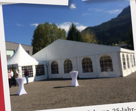
Gebäudereinigung Jäger Schwaz, 25-Jahr-Jubiläum, September 2016