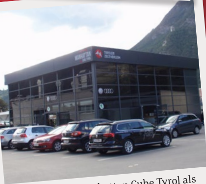
Falch Zams, Manhattan Cube Tyrol als Ausstellungs- und Büroraum während Umbauarbeiten im Sommer 2016