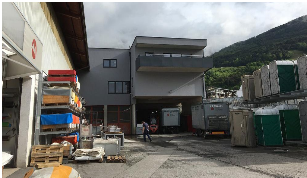
▲ Zwei Etagen und eine großzügige Terrasse – die Freude beim Einzug war riesengroß!

Nach einer vier-monatigen Bauphase konnte das neue Gebäude für unsere Mitarbeiter bezogen werden. Neben dem Zeltverleih-Hauptgebäude bekamen unsere Mitarbeiter ein neues Hauptquartier.