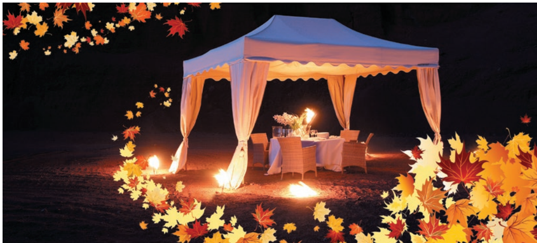
▲ Online konfigurierbar mit Vordächern, Fahnen, Bannern & Zubehör – und in einer Minute aufgebaut.

Erfolg mit der Qualität unseres Südtiroler Partners Mastertent: Faltzelte gehören zu jeder Fest-Ausstattung, ob private Party oder Firmen-Event.