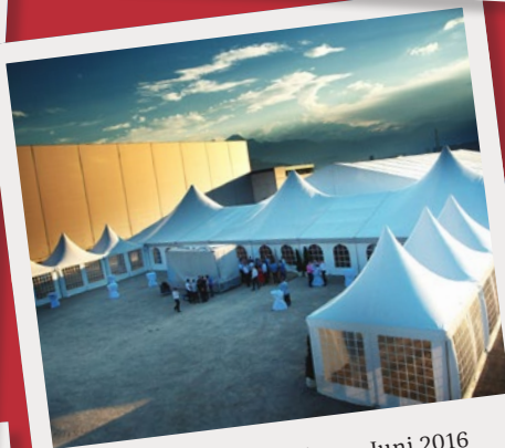
Felder KG Hall, Jubiläum, Juni 2016