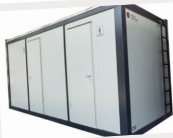
Edel aufs Töpfchen: Unser neuer WC-Container in Exklusivausführung...

Edle Toilettenanlagen und unsere neuen Sessel machen Eindruck bei jedem Fest.