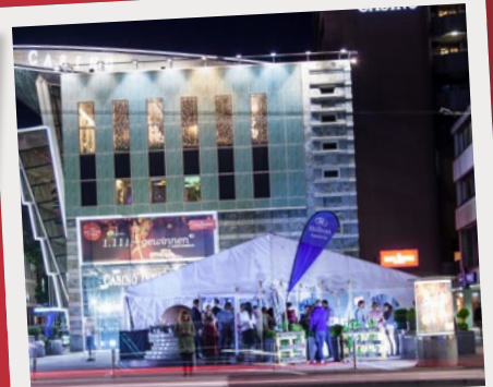
Hilton Innsbruck, Oktoberfest, September 2016