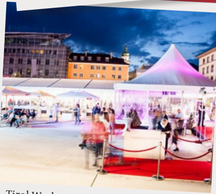
Tirol Werbung Innsbruck, Fashionshow, September 2016