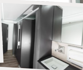
... selbstverständlich für die Damen...