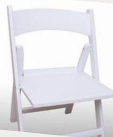
Unser neuer Klappstuhl in weiß bietet bequeme Bestuhlung für den kleinen Kreis oder's große Event.