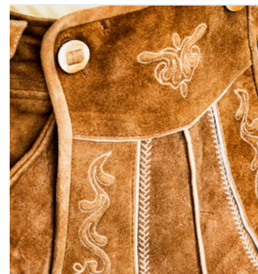
Robust, ledern und ungewaschen

Aber Achtung auf den Dreck! Der geht nicht mehr weg – denn gewaschen wird die Lederhose der Tradition nach nicht.