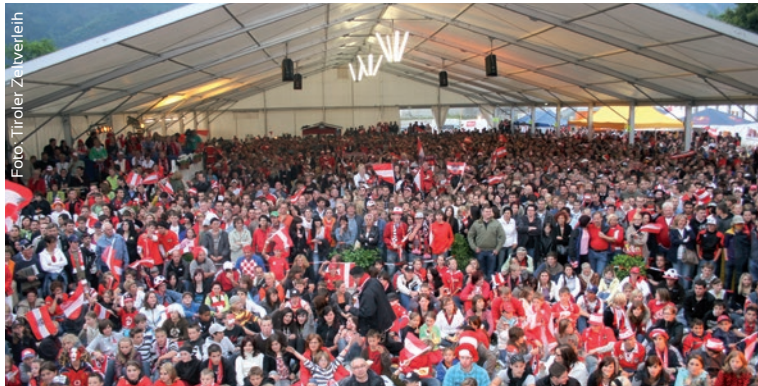
Unser Ziel: Die Tiroler Freiwilligen-Vereine über ihre Feste zu unterstützen.

Die freiwilligen Feuerwehren, die sozialen Vereine, die Traditionsvereine, Kinder-, Jugend- und Sportclubs. Ohne die Tiroler Ehrenamtlichen würde es all diese und noch viele weitere Dinge nicht geben. Tirol ist ein Land der Vereine, ein Land, in dem sehr viele Menschen gerne und freiwillig für das Wohl der anderen arbeiten. Der Verein der Tiroler Zeltfestkultur besteht, um den Vereinen zu helfen. Durch Informationen, Werbung und Partnerschaften.