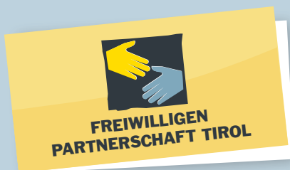
Günther Platter Landeshauptmann von Tirol