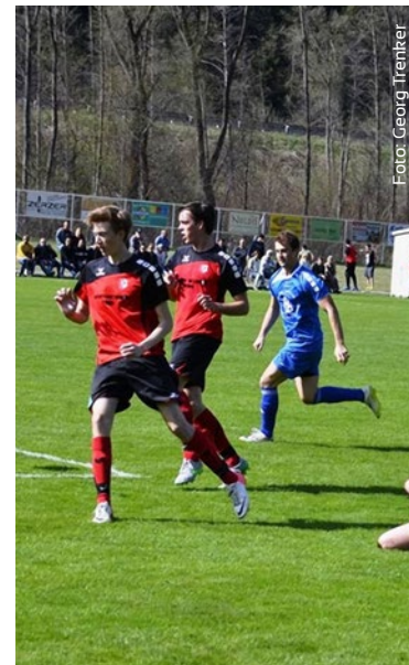
Vom Nachwuchs zum Meistertitel

Mehr rund um die Vereine Tirols auf www.zeltfestkultur.at