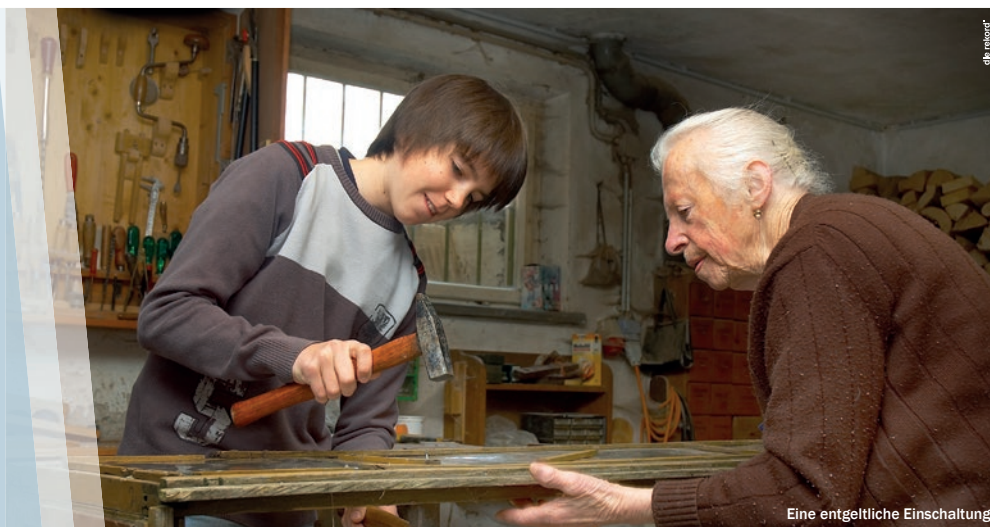
Eine entgeltliche Einschaltung